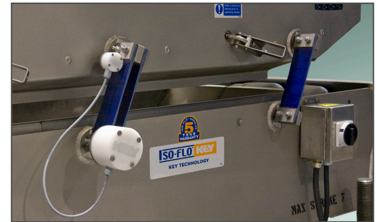
SmartArm® instalado en un Iso-Flo®