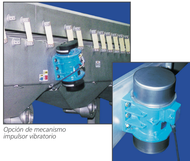
Opción de mecanismo impulsor vibratorio

Los controles modulares Forté™ ofrecen un solo punto de potencia y control para brindar una eficiencia óptima a líneas de procesamiento y envasado tanto simples como complejas.