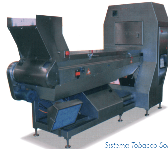
Sistema Tobacco Sorter 3

La operación es simple y los criterios de clasificación se ajustan, guardan y recuperan fácilmente, lo que permite una clasificación estable y objetiva.