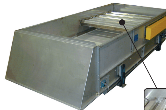
Cinta transportadora a rodillos Star

Si usted se dedica al procesamiento de tabaco, deje que Key lo ayude. Verá el trabajo realizado sin sobresaltos ni sorpresas. Cada día volverá a su hogar satisfecho y orgulloso de su calidad, sus resultados y su rendimiento.