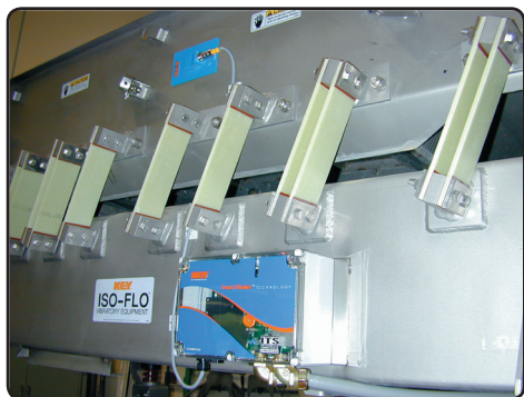
Sistema ITS™ instalado en el brazo Iso-Flo