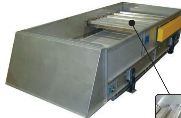
Cinta transportadora a rodillos Star

Si usted se dedica al procesamiento de tabaco, deje que Key lo ayude. Verá el trabajo realizado sin sobresaltos ni sorpresas. Cada día volverá a su hogar satisfecho y orgulloso de su calidad, sus resultados y su rendimiento.