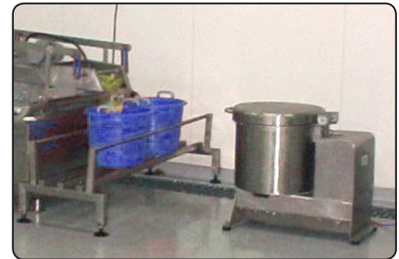
Secadora Compacta y Sistema de Lavado de Key