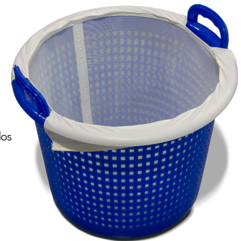
Canasta con Revestimiento Instalado