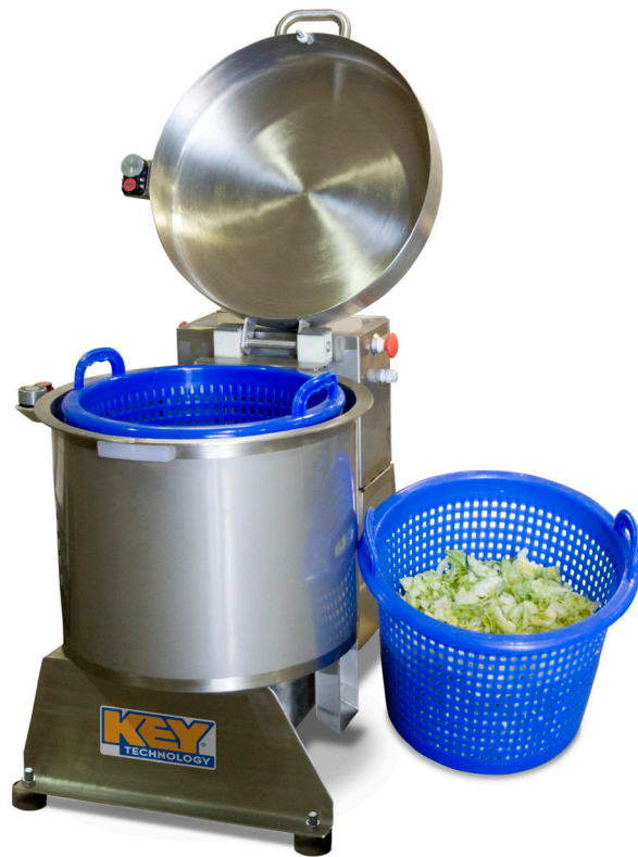
Secadora Compacta con tapa abierta

La Secadora Compacta de Key brinda una solución flexible para extraer el agua de una gran variedad de productos de corte en fresco, aumentando la calidad de su producto y prolongando su duración. Simple y eficiente, su diseño centrífugo tiene valores ajustables de velocidad y tiempo para optimizar el secado de vegetales de hoja, vegetales cortados y hierbas. Robusta y fiable, la Secadora Compacta funciona perfectamente con la Lavadora de Canasta y la Empaquetadora AVSealer de Key para darle una solución integral de procesamiento y empaquetado.